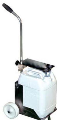
Pro fog 2B

Existe una versión fija del equipo, en la que se instalan las boquillas en puntos estratégicos de la sala a desinfectar. Las características de la instalación se determinan, previo estudio, en función del lugar de aplicación y las necesidades.