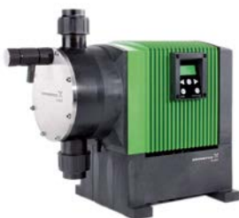
Bombas de membrana