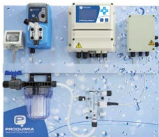
Clorimatic Aljibe Cloro

El controlador que incorpora el panel actúa como regulador para lograr los parámetros óptimos para el mantenimiento del nivel de cloro en el aljibe, activando la bomba dosificadora que responde según el valor prefijado por el usuario.