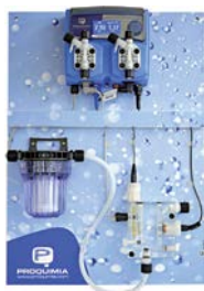
Clorimatic Aljibe Cloro-pH

Los controladores que incorpora el panel actúan como reguladores para lograr los parámetros óptimos para el mantenimiento del cloro y pH en el aljibe, activando las bombas dosificadoras que responden según los valores prefijados por el usuario.