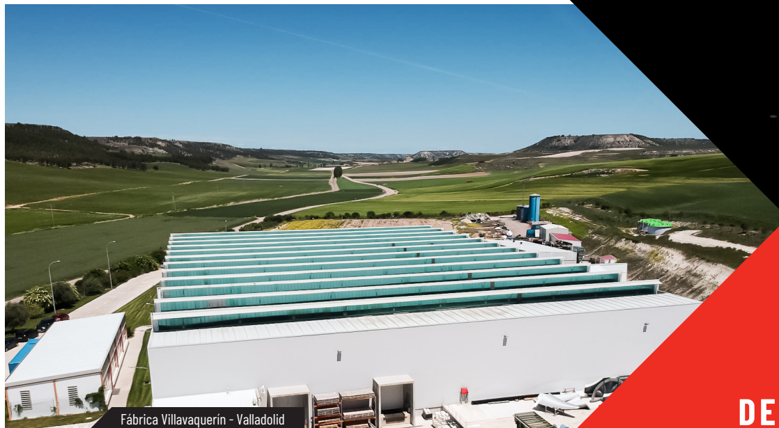
Fábrica Villavaquerín - Valladolid