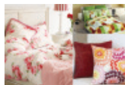
Ropa de Cama

digital hires "Sus socios en producción de color"