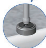
Conexión en línea con el gotero PCJ