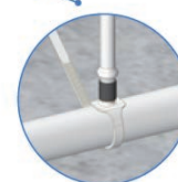
Conexión con tubería UniRAM®

Barcelona: +34 935 737 422 · Madrid: +34 916 746 050 · Málaga: +34 952 244 624 · Murcia: +34 968 898 002 · Sevilla: +34 955 981 990 · Valencia: +34 961 667 013 · Portugal: +351 243 329 097 · Marruecos: +212 522 862 258