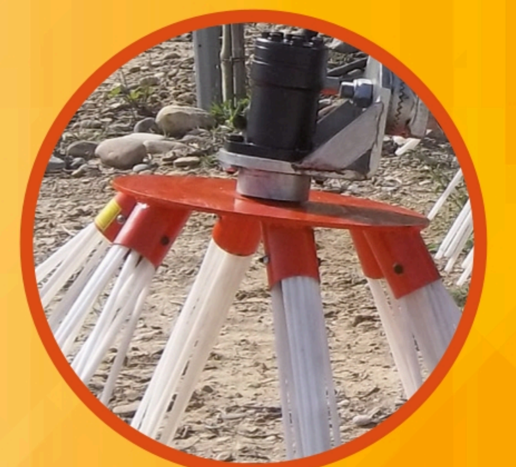
Fácil cambio de escobas