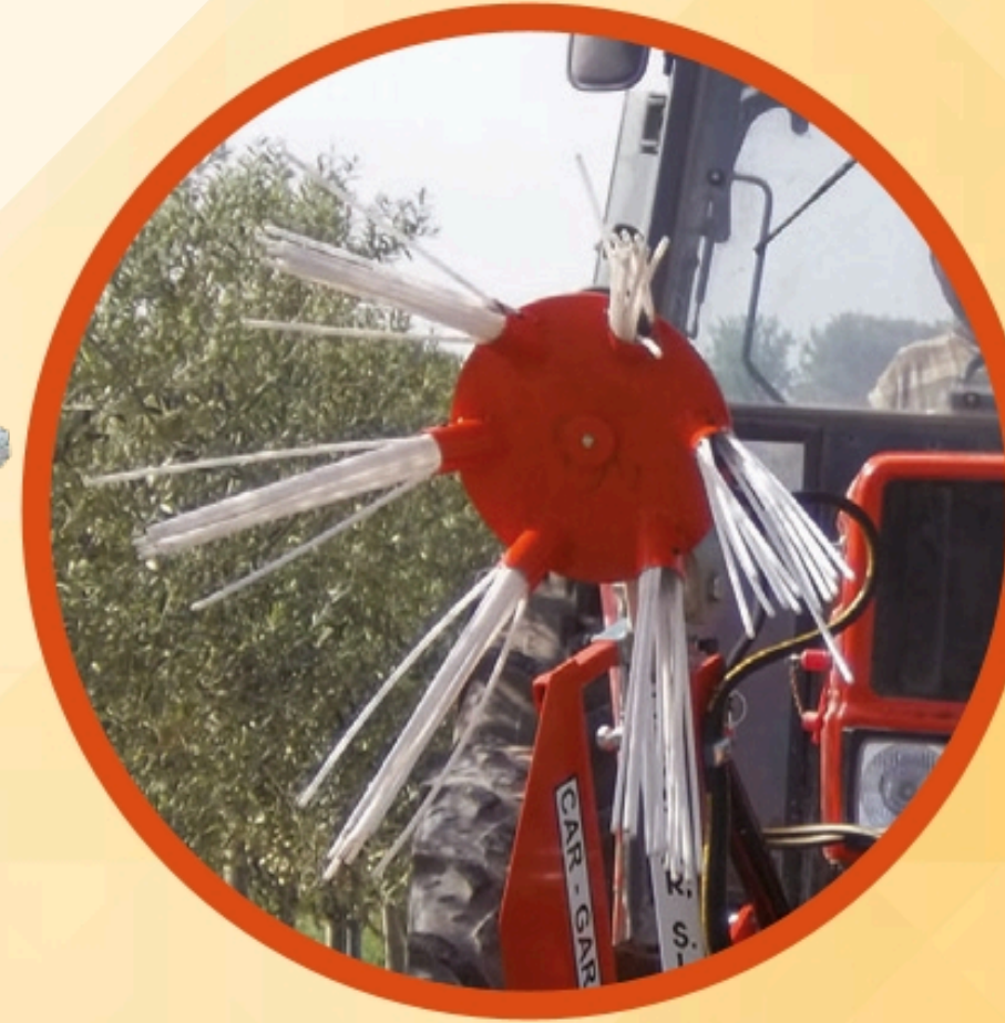
Elevación del brazo a 90°