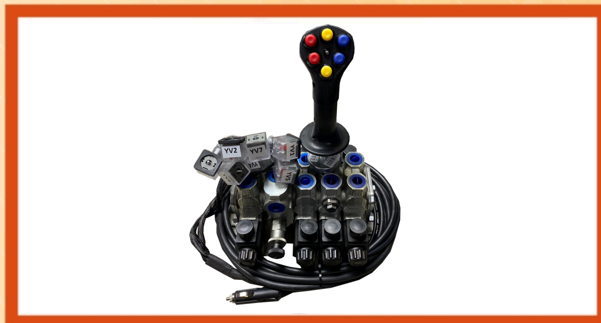
KIT ELECTRO-VÁLVULAS JOYSTICK