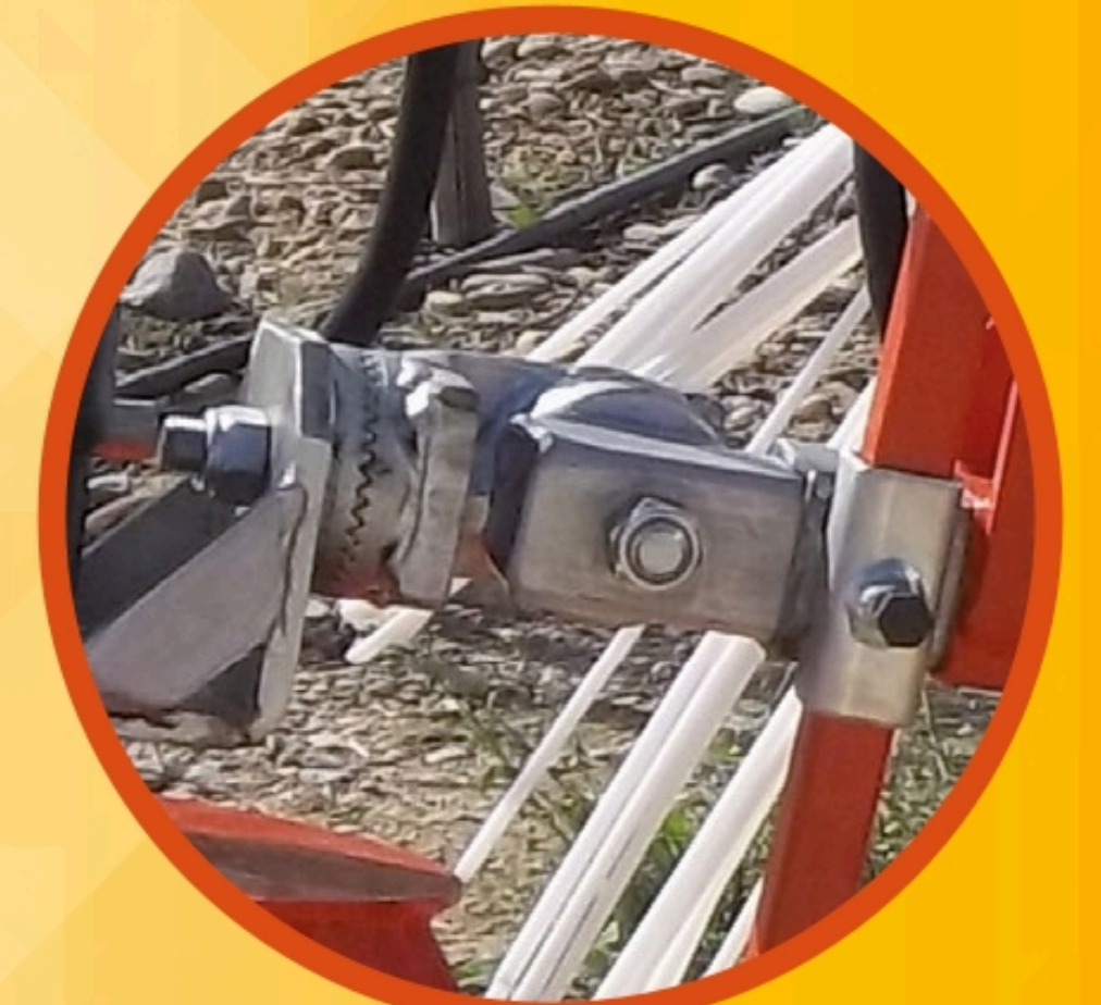
Platos regulables en todos los ángulos