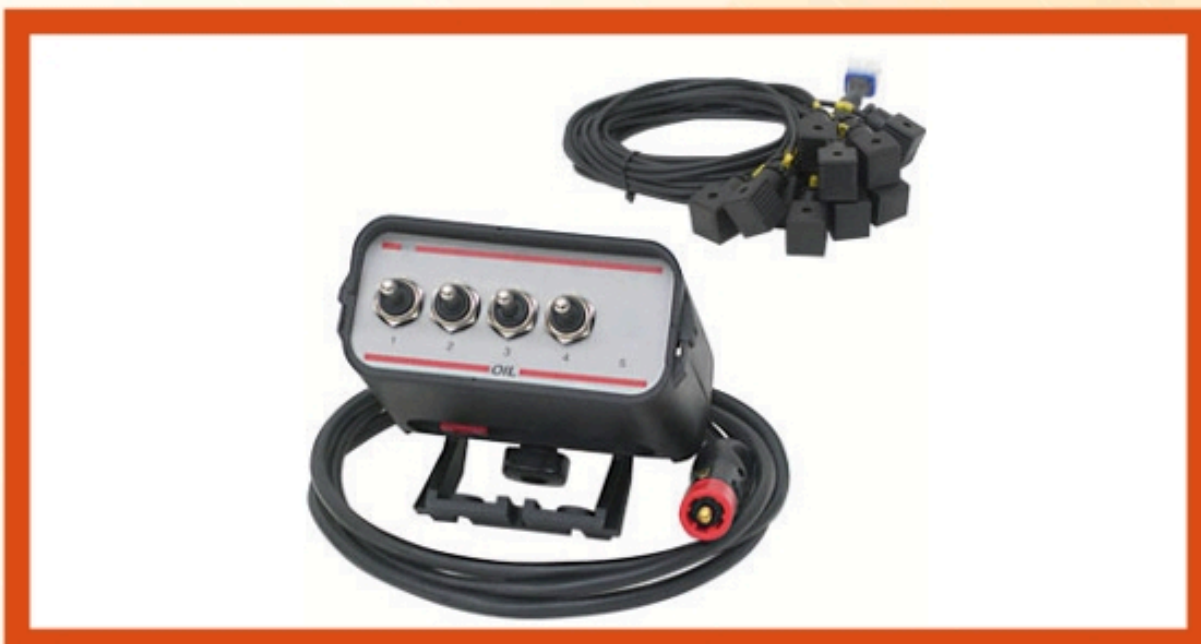
KIT ELECTRO-VÁLVULAS CAJA