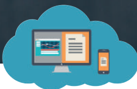
Gestión Documental (ECM)