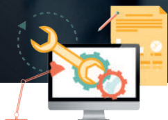
Gestión de procesos de negocio (BPM)