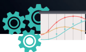
Planificación de Recursos Empresariales (ERP)

Disponemos de herramientas para dar valor añadido a las compañías, ayudando a que logren los objetivos de crecimiento :